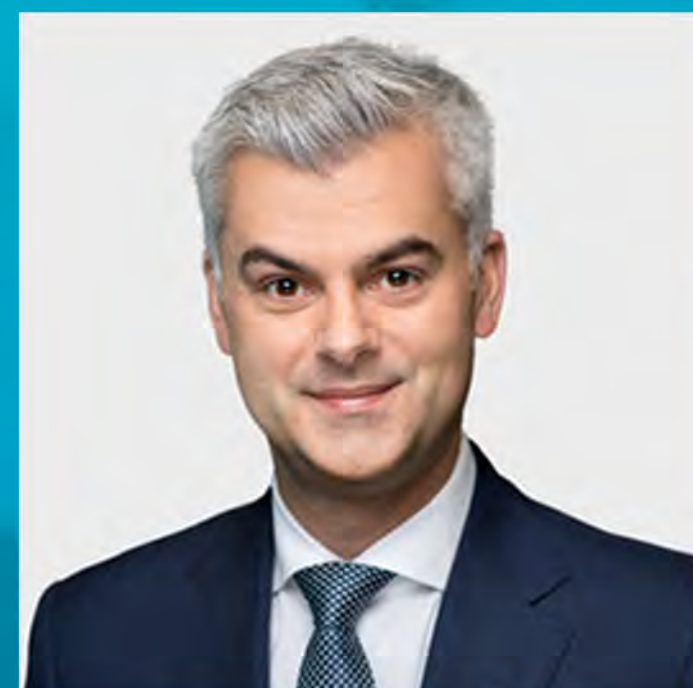
Renault Lortie Energir